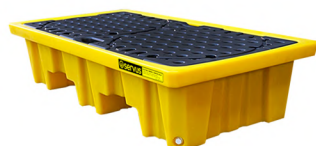
Pallets para 2 tambores