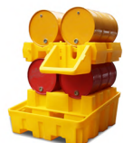
Centros de administración