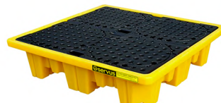
Pallets para 4 tambores